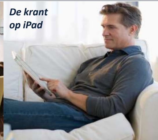
De krant op iPad